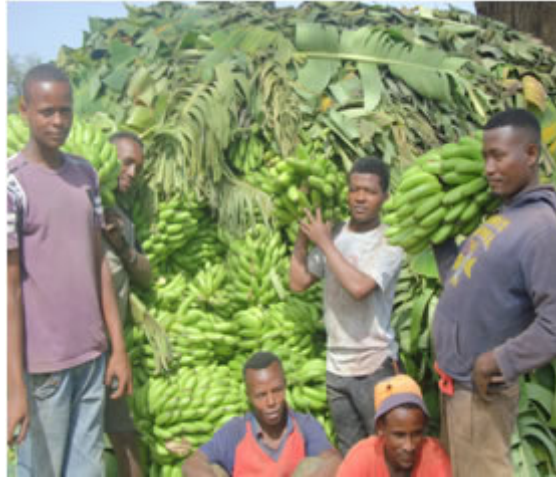
በቀጣይ የገጠር ወጣቶች ስራ አጥ አይሆኑም (አርባ ምንጭ አካባቢ)