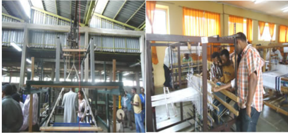
ሠልጣኖች በብረታ ብረትና ሸማ ስራ ስልጠና ላይ

42 ባለሙያዎች በብረታ-ብረትና እንጨት 32 ባለሙያዎች ደግሞ በጨርቃ ጨርቅና አልባሳት የሰለጠኑ ሲሆኑ በዘርፉ ለተሠማሩ ኢንተርኘራይዞች የተሟላ ድጋፍ መስጠት ይችሉ ዘንድ በዋናነት ወቅታዊ የክህሎት ክፍተት በሚታይባቸው በጥሬ ዕቃና በማሽን አጠቃቀም እና በሾኝ ማኔጅመንት የቲዩሪና የተግባር ሥልጠና ያገኙ ሲሆን የተግባር ሥልጠናው በዎርክሾኝ ውስጥ ባሉ የተለያዩ መሣሪያዎች የተደገፈና በልብስ ስፌት የፓተርን ሥራና የሽመና ስራዎችን ጨምሮ እንዲሠሉጥኑ ተደርጓል።