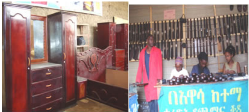
በቀረበላቸው የመረጃ አቅርቦት ድጋፍ መሠረት ውጤታማ የሆኑ ማኅበራት ሥራዎች (ሀዋላ)

ከዚህም ባለፈ ወደ መካከለኛ ባለሀብትነት የተቀየሩ 123 ማኅበራት ራሳቸውን ችለው እየተንቀሳቀሱ ይገኛሉ።