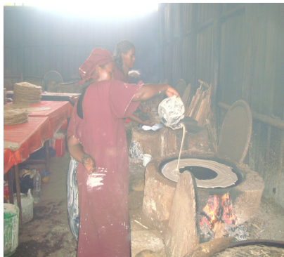
እንጆራ በመጋር የተደራጁ ሴቶች በተፈጠረላቸው የገበያ ዕድል እየተጠቀሙ ያሉ (ሀዋሳ ዩኒቨርሲቲ)

በአጠቃላይ በበጀት ዓመቱ ዘጠኝ ወራት በፓኬጅ ፕሮግራም ለተደራጁ አባላት የብር 96,888,074 የገበያ ዕድል ሲመቻች በመደበኛው ፕሮግራም ደግሞ የብር 16,105,139 የገበያ ዕድል ተፈጥሮ ከ13 ሺህ በላይ አንቀሳቃሾች ተጠቃሚ ሆነዋል።