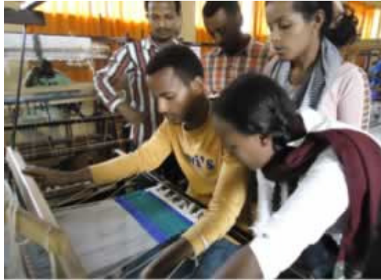
የቴክኒክ አማካሪዎች ስልጠና ሲወሰዱ (ኢ.ኢ.)

ከዚህ በተጨማሪ የአንድ ማዕከል አገልግሎትና የማማከር አገልግሎትን በሚመለከት ያጋጠሙ ችግሮችን ለመረዳት በክልሉ ወደሚገኙ የተለያዩ ከተሞች በመንቀሳቀስ ችግሮችን የመለየት ስራ ተሰርቷል። እንዲሁም መልካም ተሞክሮዎችን ወደ ሌሎች ለማስተላለፍ የሚያስችል የክትትልና የድጋፍ ስራ የተቀመጠ ሲሆን በዚሁ መሠረት በአሁኑ ወቅት በክልሉ በሚገኙ 45 ክፍለ-ከተሞች እና 70 ወረዳዎች የአንድ ማዕከል አገልግሎት እንዲሰጥ በማድረግ ላይ ይገኛል።