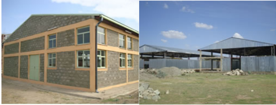
ያለቁ የክላስተር ማዕከላት

በዚህ ድጋፍ ዙሪያ ያለውን ችግር በዘላቂነት ለመፍታት በክልሉ ደረጃቸውን የጠበቁና ለማምረቻ አገልግሎት የሚውሉ 309 ብሎክ ህንፃዎች በ22 የከተማ አስተዳደሮች እየተገነቡ ይገኛል። ግንባታቸውም ሲጠናቀቅ ኢንተርፕራይዞች ተገቢውን ተመጣጣኝ ክፍያ በመፈፀም የሚጠቀሙበት ይሆናል። በዚህም መሠረት በሀዋሳ፣ በሀላባ፣ በሶዶ፣ በይርጋዓለም፣ በአለታወንዶና በዱራሜ ከተሞች ግንባታቸው ተጠናቆ ለርክብክብ ዝግጁ ሆነዋል። የቀሪ ህንፃዎች ግንባታም በዞን፣ በከተማ አስተዳደርና በማዘጋጃ ቤቶች ርብርብ በቅርቡ እንደሚጠናቀቁ ተረጋግጧል።